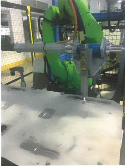
Plastik pimlerin plazma işlemi: Aktivasyon sayesinde yüzey enerjisi artıyor. Bu da yüzeyin en iyi şekilde ıslatılabilmesine yarıyor ve güvenli, uzun süre dayanıklı yapıştırma sağlıyor.

The way Openair-Plasma works is both simple and effective: the deionizing effect of the plasma beam neutralizes loose particles of dust and removes them from the surface of the material. At the same time, the plasma activates the plastic surface to be treated by incorporating functional groups containing oxygen and nitrogen into the substrate which increases the polar fraction of the surface energy. This ensures complete, homogenous wettability of coatings and adhesives applied to the treated surface and thus durable adhesion. The plasma beam follows the component geometry and treats the surface where needed with millimeter precision. Furthermore, as an inline process, it can be integrated directly into the production process without the need for an off-line batch process in a separate chamber system. The components remain in the production line and can be processed for adhesion immediately after plasma treatment. This streamlines production processes, making them faster, simpler and particularly cost-effective.